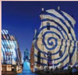
Giornata mondiale dell'alfabetizzazione 2008