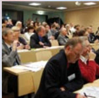
Convegno «Il vostro target: PMI» 2009