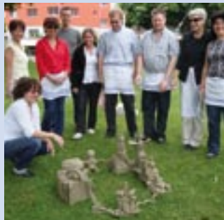
Giornata dei collaboratori 2009