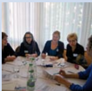
Convegno SOS 2009