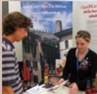
Festival della formazione continua Ticino 2008