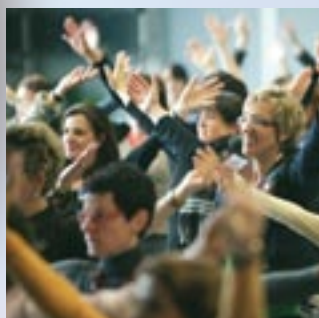
Convegno delle donne 2008